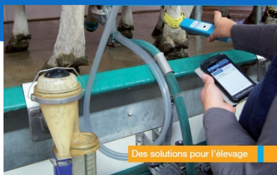
Des solutions pour l'élevage

GAGNEZ DU TEMPS à la pesée grâce à une identification fiable et facilitée